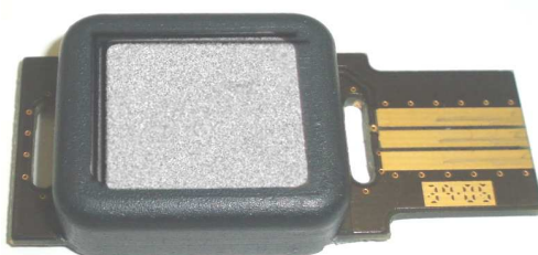
Temperatuur datalogger (zeer compacte versie).